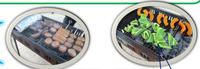
炭のいい匂い 美味しそう~

5/19(月)20(火)にバーベキューを行いました♪♪ テラスにて炭火で焼いた食材はとておいしい匂いで、 皆様もワクワクされてました♪ おかわりもあっという間に、ほぼ完食でした!!