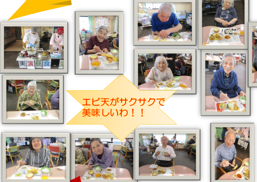
エビ天がサクサクで 美味しいわ!!