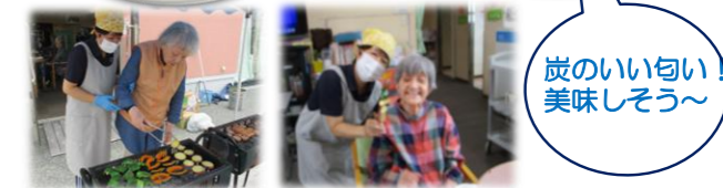
見事な串だわ~ 美味しそう♪