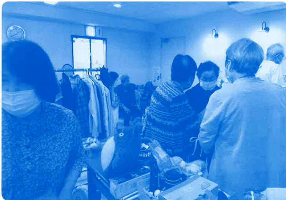
ケアハウス「バザー会」の様子

「淳風会」の「淳」という言葉こそ創業以来先輩から引き継がれ、これからも引き継いでゆく法人理念につながります。「淳」とは「情けに篤く、素直で、飾り気のない」ということです。愚直でも、深く切ない想いをもって暖かく親切な社会福祉事業の展開を目指します。