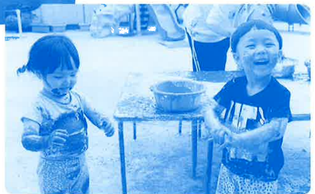
2023年 安治川保育園 ボディペインティング