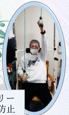
プーリー 円背防止

ご自身の持つておられる能力が維持できるよう、一人ひとりの利用者様にあった生活リハビリにスタッフ全員で取り組んでいます。