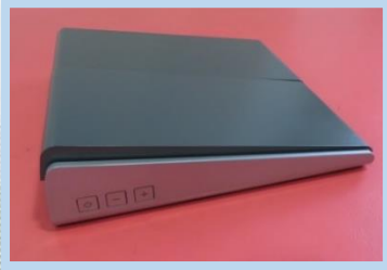
モビジット：浮腫の軽減・可動域の増幅