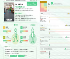
トルトで歩行をAI分析