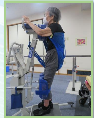
スカイリフト 立ち上がり訓練