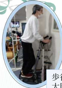
歩行時に大切な 大腿部の筋肉強化