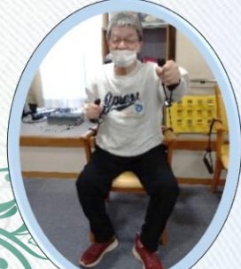
上腕二頭筋の運動