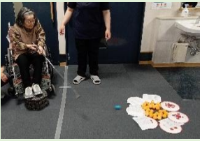
ボール出しゲーム