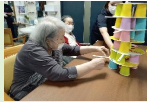
紙コップジェンガ