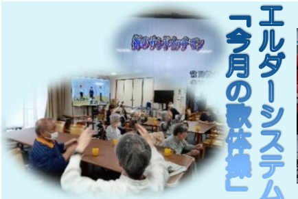
エルダーシステム 「今月の歌体集」