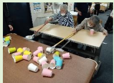
紙コップブリッジ渡し