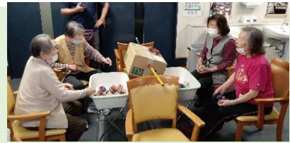
回転座のお手玉乗せ