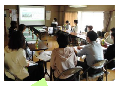
意見交換の時はこんな雰囲気です。

「ケアマネジャーのシャドウワークについて」や「地域の社会資源を知りたい」「BCPについて」等勉強会をしたいとの意見がありました。また、企画実現できるようにしていきたいです。 2月は、昨年度に居宅介護支援所として運営指導を受けたケアマネジャーから指導内容の報告と着眼点を参加者で共有しました。内容と