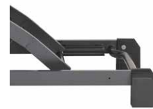
最低床高21cm (Hタイプ・Xタイプ)