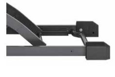
最低床高15cm (Xタイプのみ)