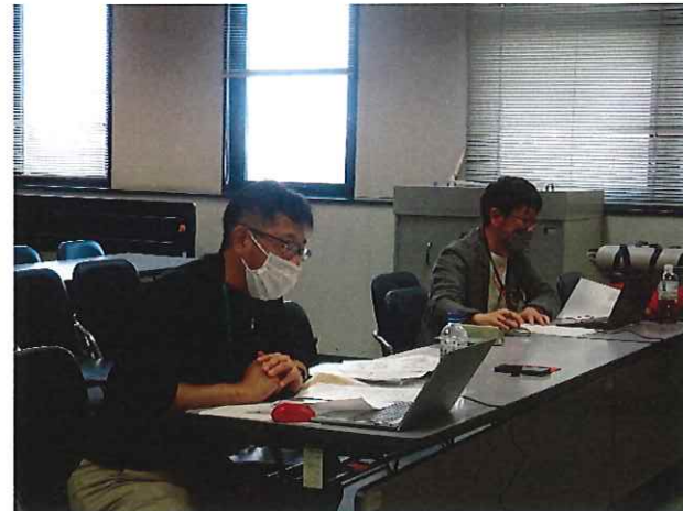
(別室にて Zoom グループワーク対応風景)