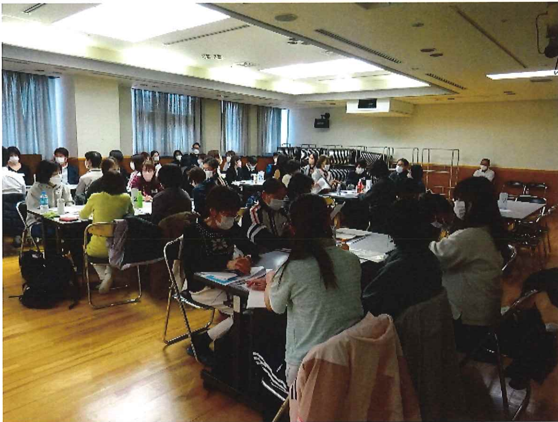
令和6年2月17日 薬介連携ネットワーク型地域ケア会議開催様子写真